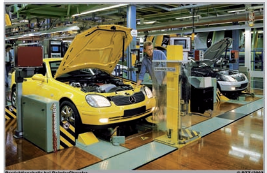
Produktionshalle bei DaimlerChrysler

Teilnahmeberechtigt sind Personen Jahrgang 1979 und jünger. Wir bitten dringend um Anmeldung, da die Teilnehmerzahl auf 15 Personen begrenzt ist.